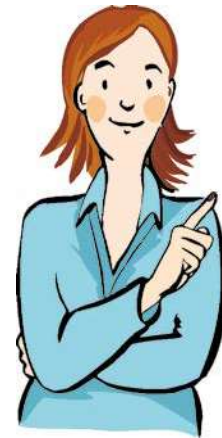
Illustration: Reinhild Kassing