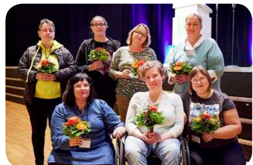
und die Gründungs-Sprecherinnen