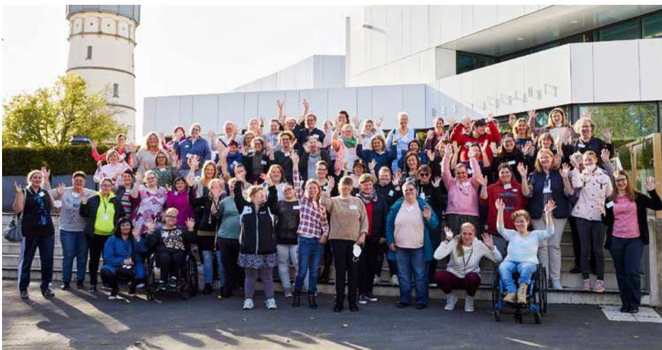
Die Teilnehmerinnen der 1. Voll-Versammlung 2022

Illustrationen: Lebenshilfe Bremen e.V., Illustrator Stefan Albers, Atelier Fleetinsel, 2015.